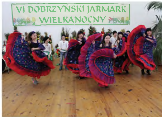
Cygański taniec w wykonaniu uczniów SP w Sadłowie