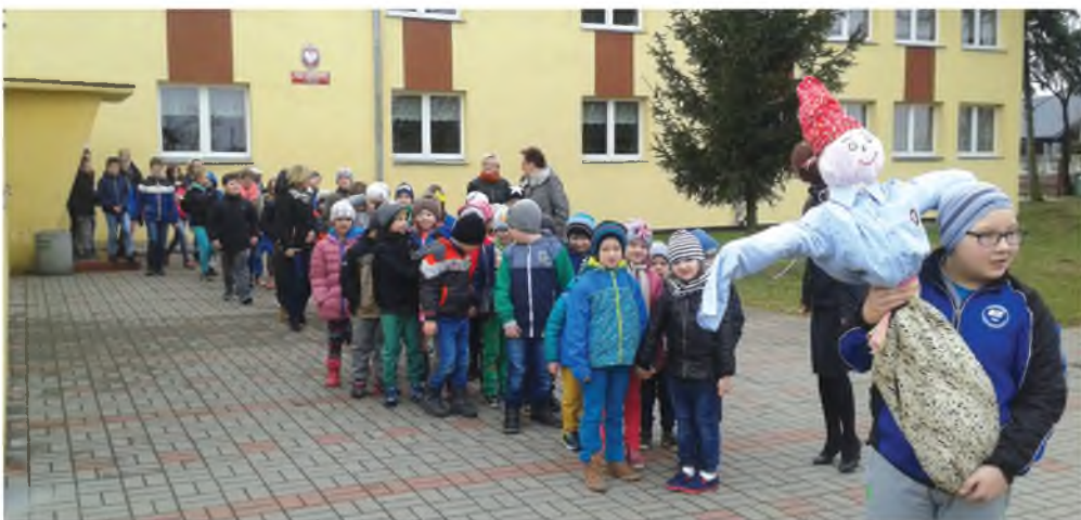
SP w Stępowie