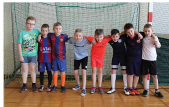
Grupa II - chłopcy z rocznika 2007/2008