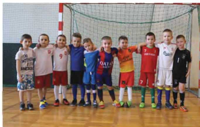
Grupa I - chłopcy z rocznika 2009/2010