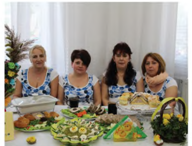
KGW Puszcza Rządowa