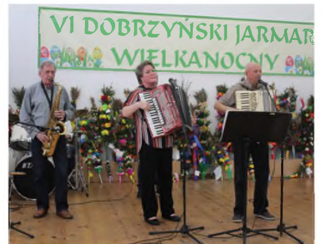
Kapela Sami Swoi