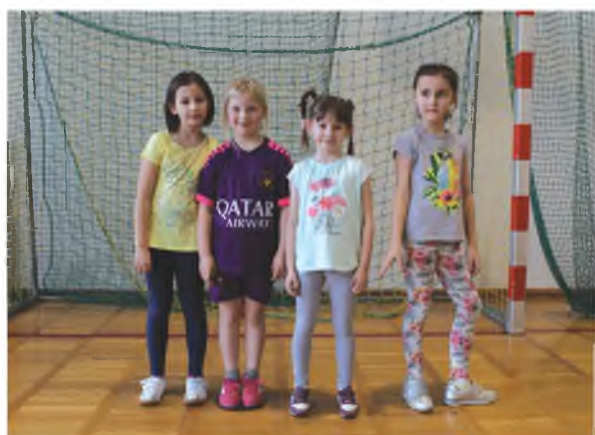
W treningach piłkarskich aktywnie uczestniczą również dziewczyny

Zajęcia odbywają się dwa razy w tygodniu w każdej grupie wiekowej. Do dyspozycji szkółki pozostaje sala gimnastyczna oraz orlik przy gimnazjum w Kowalkach. Treningi w Gminnej Akademii Piłkarskiej „Pasja” to radość, zabawa, aktywne spędzanie wolnego czasu i, co najważniejsze, szkolenie i zdobywanie umiejętności piłkarskich. Sport uczy dzieci wytrwałości, pokory, rywalizacji, znoszenia porażek i doceniania sukcesów.