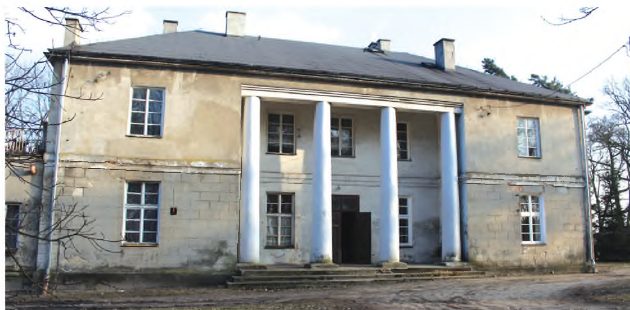
Pałac w Sadłowie odzyska dawny blask

W budżecie na obecny rok wydatki określono na kwotę 34,6 mln zł, z czego 28,7 mln zł przeznaczono na wydatki bieżące, a 5,8 mln zł na inwestycje. Wśród wydatków bieżących najwięcej kosztować będą oświata i wychowanie (9,7 mln zł) oraz pomoc społeczna (10,7 mln zł). Tak wysoka kwota bierze się z dotacji celowej z budżetu państwa na świadczenia wychowawcze z programu „Rodzi-