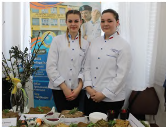
Stoisko ZS nr 2