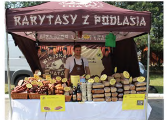
Można było kupić smakołyki z Podlasia