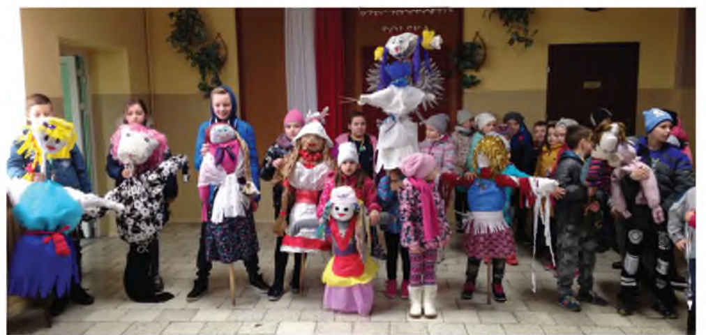
SP w Sadłowie