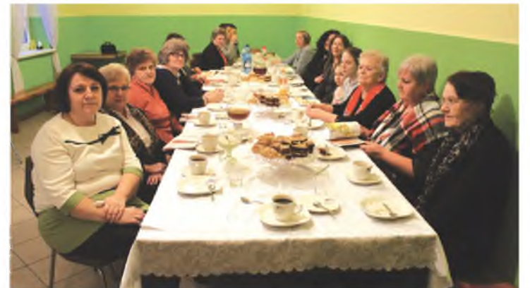
Spotkanie przebiegło w miłej atmosferze

W spotkaniu uczestniczyły również konsultantki ze znanej firmy kosmetycznej. Specjalistki od pielęgnacji ciała udzielały wielu praktycznych porad, a także wykonywały makijaże pokazowe i masaże dłoni. Dzięki zaproszonym gościom panie z KGW miały przyjemność przetestowania na własnych dłoniach peelingu i zapoznania się z nowościami kosmetycznymi.