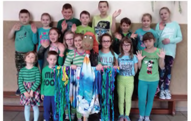
SP w Zakroczu