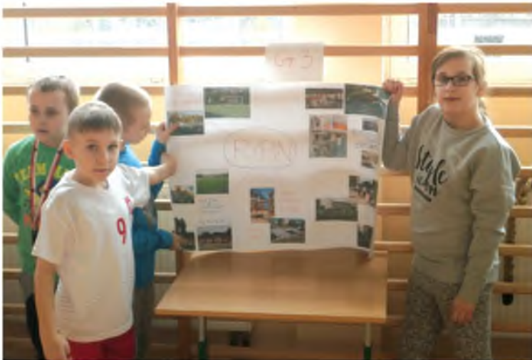
SP w Starorypinie Rządowym

Chcąc przywitać tak oczekiwaną porę roku, uczniowie klas 0–VI wraz z wychowawcami przemarszerowali z kukłami marzanny na boisko szkolne, aby tam dokonać obrzędu pożegnania zimy i powitania wiosny. Uczniowie radosnymi okrzykami przywołali wiosnę, żegnając zimę. Ponadto dzieci uczestniczyły w konkursie na kukłę marzanny. Zabawę wygrały dzieci z klasy 0.