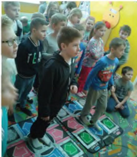
SP w Borzyminie