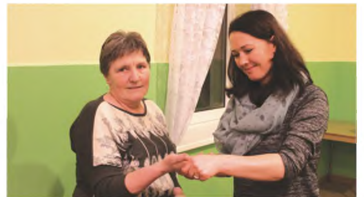
Relaksacyjny masaż dłoni