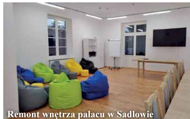
Remont wnętrza pałacu w Sadłowie