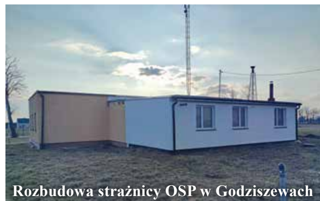
Rozbudowa strażnicy OSP w Godziszewach