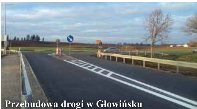
Przebudowa drogi w Głowińsku

gi powiatowej. Modernizacja była możliwa m.in. dzięki wsparciu finansowemu gminy Rypin. W listopadzie ubiegłego roku między miejscowościami Linne, Nowe Sadłowo i Sadłowo Rumunki oddano oficjalnie do użytku ponad kilometr nowej drogi gminnej. Koszt rozbudowy wyniósł ponad 360 tys. zł. Dofinansowanie – w kwocie blisko 80 tys. zł – pochodziło z Funduszu Ochrony Gruntów Rolnych. Pod koniec minionego roku oddana do użytku została przebudowana droga w miejscowości Głowińsk. Remont kosztował blisko 2 mln zł. Gmina Rypin pozyskała dofinansowanie z Funduszu Dróg Samorządowych w wysokości ponad 1 mln zł. Odcinek drogi zyskał nową nawierzchnię, wzmocnione i utwardzone zostały pobocza oraz powstał nowy chodnik. W tym samym czasie dobiegły też końca prace związane z przebudową drogi gminnej w Kowalkach. Inwestycja kosztowała blisko 1 mln zł. Zadanie współfinansowane było w wysokości 500 tys. zł ze środków Europejskiego Funduszu Rolnego na rzecz Rozwoju Obszarów Wiejskich.