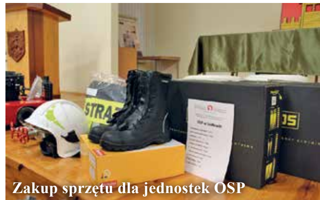
Zakup sprzętu dla jednostek OSP