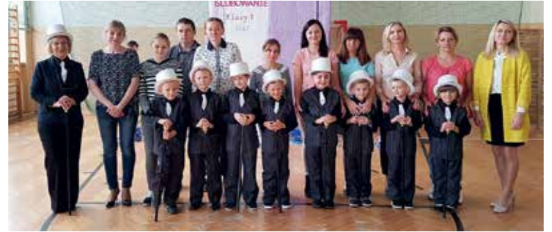
SP w Sadłowie