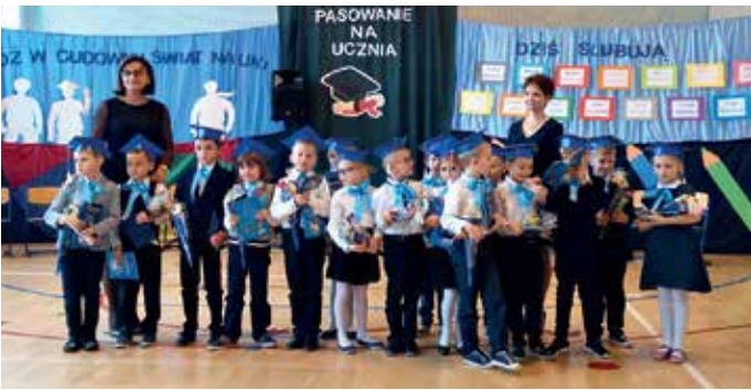
SP w Borzyminie