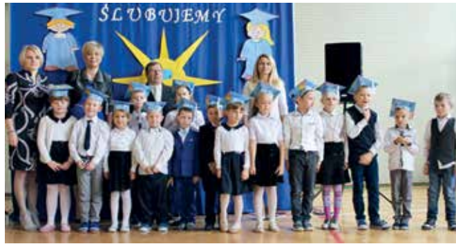
SP w Starorypinie Rządowym