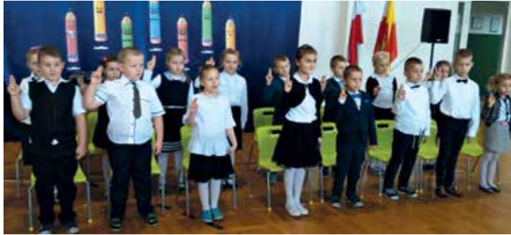
SP w Kowalkach