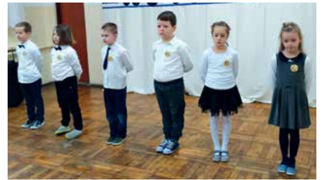
SP w Stępowie