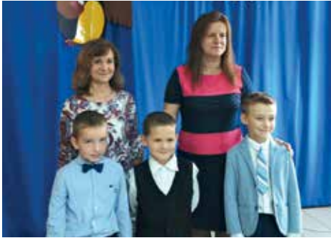
SP w Zakroczu

minków i wspólnych zdjęć. Gratulacje i życzenia w pierwszej kolejności składali dyrektorzy szkół, następnie wychowawcy klas pierwszych, uczniowie klas starszych, przedstawiciele władz samorządowych oraz zaproszeni goście. Na zakończenie uroczystości na wszystkich czekał słodki poczęstunek.