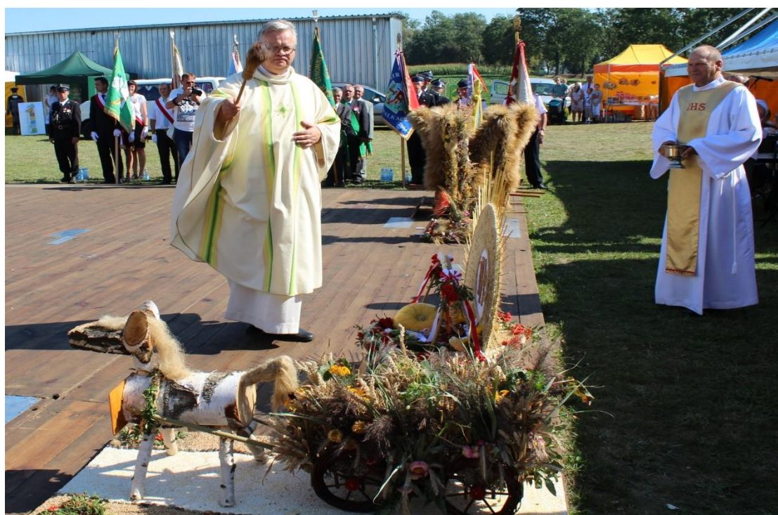
Poświęcenie wieńców dożynkowych.