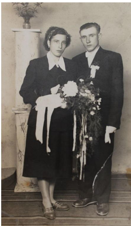
Fotografia ślubna z 1956 roku.