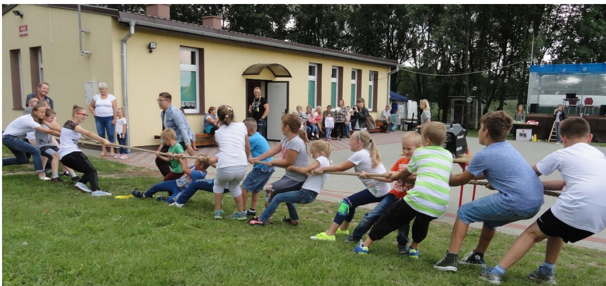
Przeciąganie liny w Rusinowie.

Od szeregu lat w gminie Rypin organizowane są letnie festyny integracyjne. Celem organizacji tego typu imprez jest integracja środowisk lokalnych. Festyny są okazją do wspólnych spotkań, zabaw połączonych z prezentacją działalności różnych grup społecznych i organizacji (szkół, KGW, OSP) działających w danym środowisku. Cykl letnich spotkań integracyjnych odbył się w 17 miejscowościach.