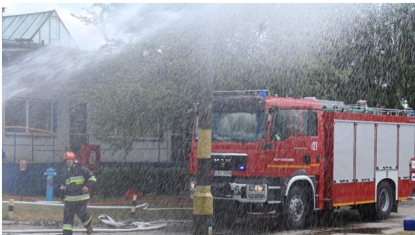
Samochód pożarniczy OSP Sadłowo podczas ćwiczeń.