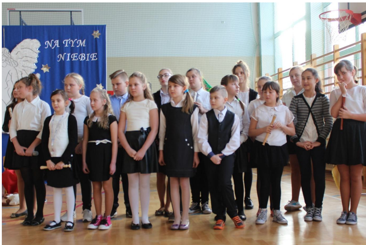
SP Starorypin Rządowy.