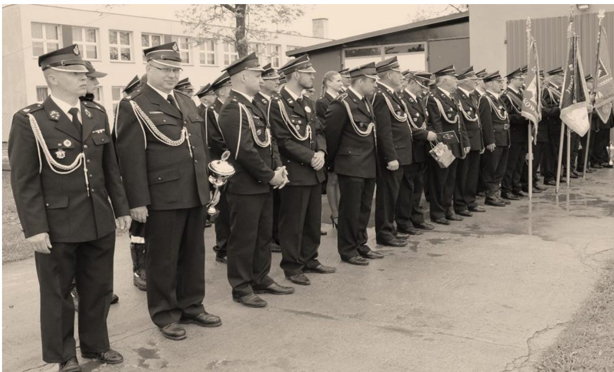
Zbiórka strażaków z gminy Rypin.