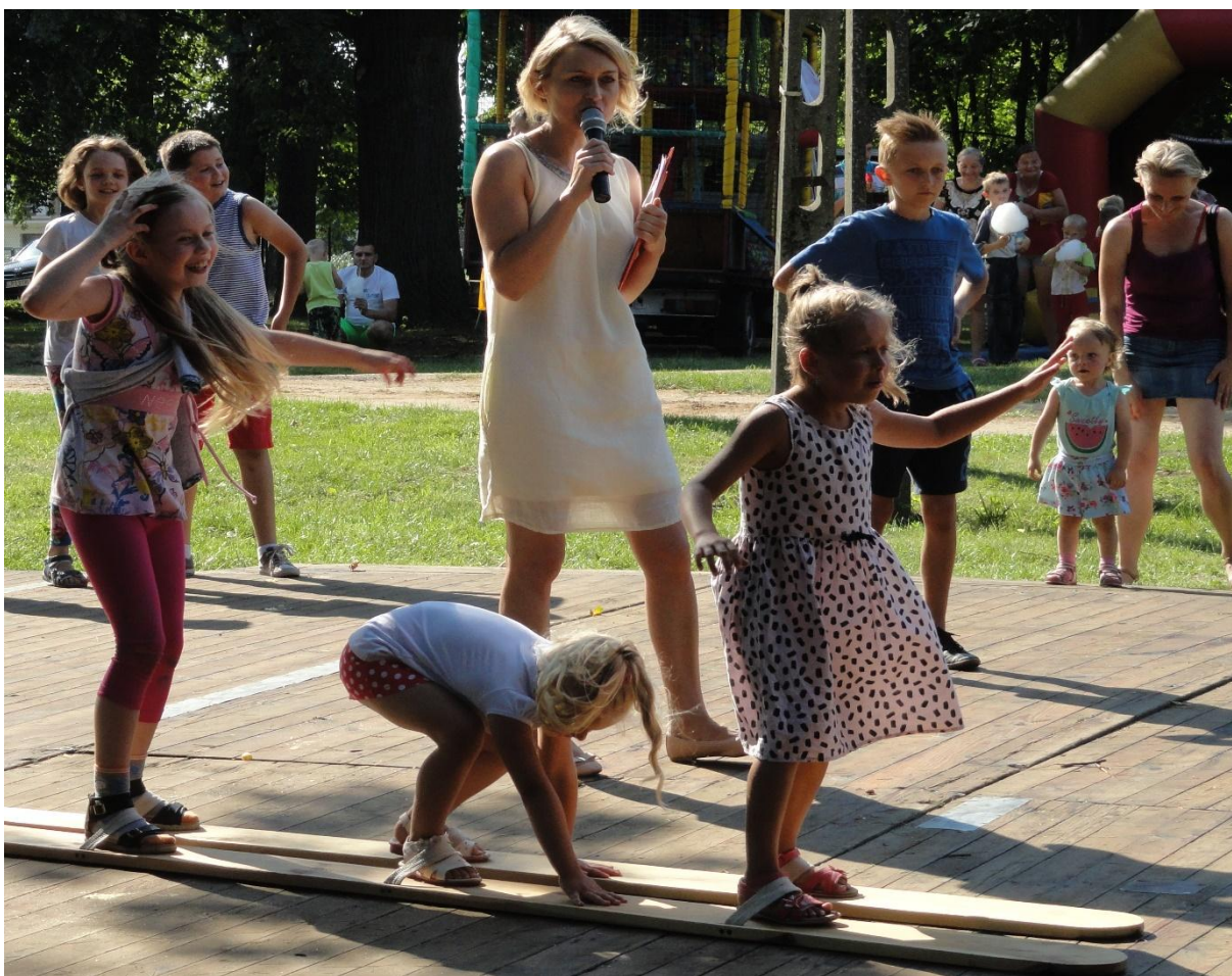
Drużynowy bieg na nartach podczas festynu w Sadłowie.