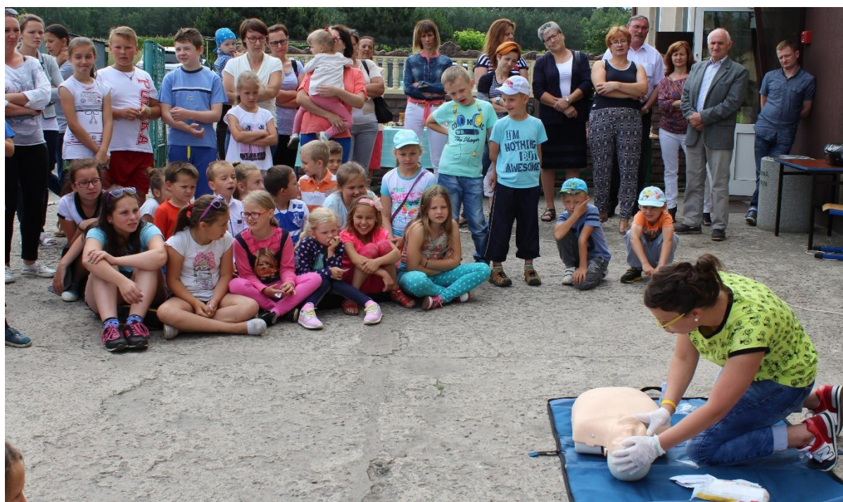
SP w Zakroczu – nauka resuscytacji.