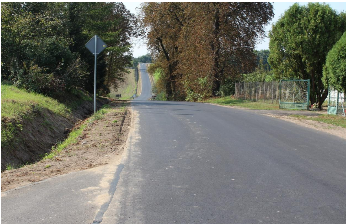
Droga w Rusinowie od spichlerza w kierunku drogi wojewódzkiej Rypin – Wąpielsk.

W dniu 23 września 2016 roku odbył się odbiór techniczny zadania pn. „Przebudowa drogi w Stawiskach” . Odcinek o długości 0,950 km wybudowało Przedsiębiorstwo Robót Drogowych w Lipnie. Koszt budowy wyniósł 292.494,37 zł. Zakres robót budowlanych prowadzonych w ramach powyższej inwestycji obejmował: przebudowa drogi gminnej ze żwirowej na utwardzoną, budowę skrzyżowania z drogą powiatową, budowę i przebudowę zjazdów, budowę przepustu, wykonanie ścieków odwadniających, zabezpieczenie elementów sieci teletechnicznej, wycinkę drzew, wykonanie wpustu deszczowego, budowę studni chłonnej, montaż oznakowania i urządzeń bezpieczeństwa ruchu drogowego.