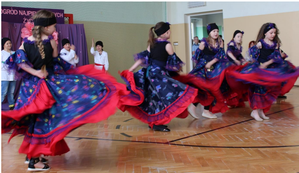
Taniec cygański w wykonaniu uczniów SP w Sadłowie.