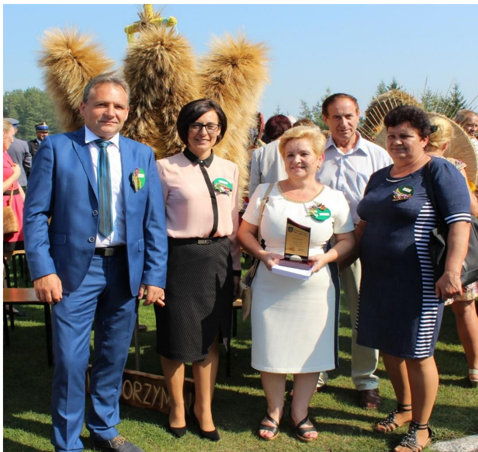
Nagrodzeni rolnicy i wieniec z Borzymina.