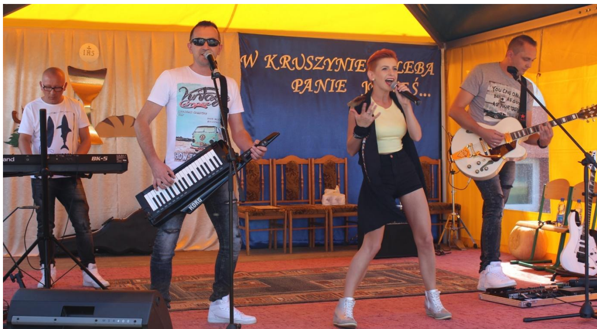
Zespół „Refleks” na estradzie...