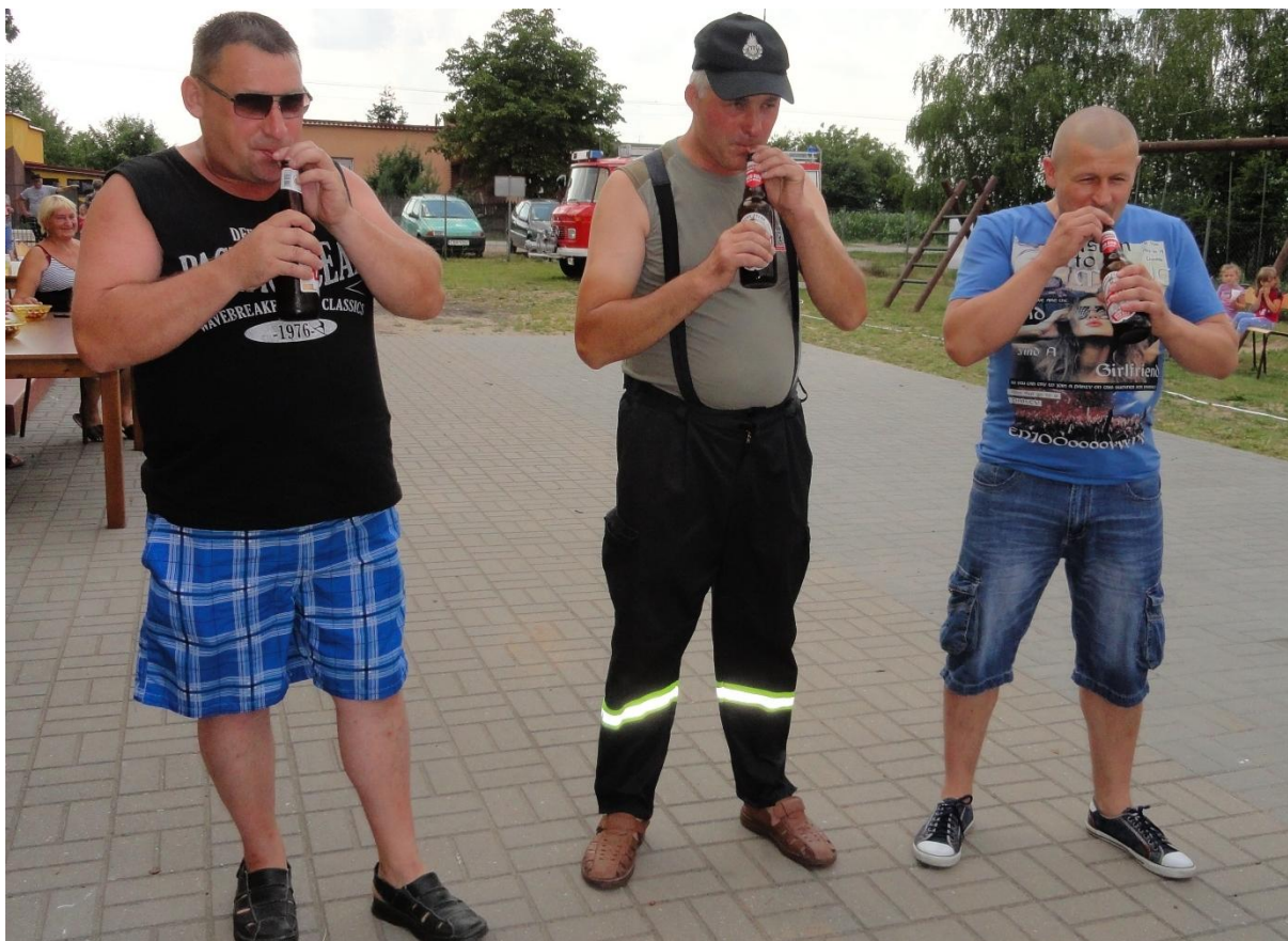
Rypałki – zawody w picciu piwa przez słomkę.