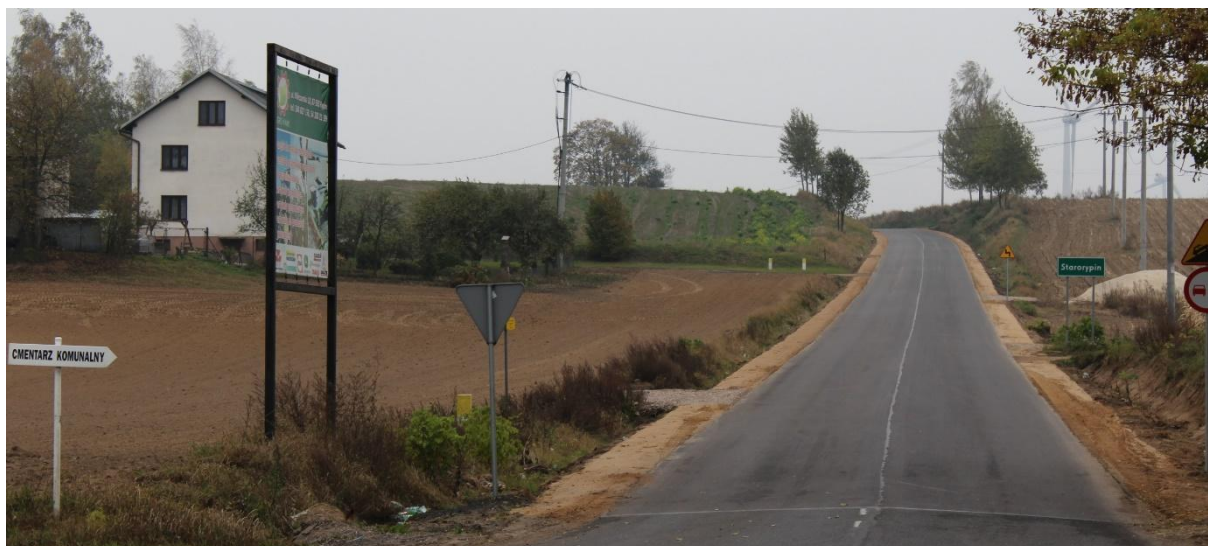
Droga w kierunku Gaspolu i Osiedla Mieszkaniowego w Starorypinie Prywatnym.