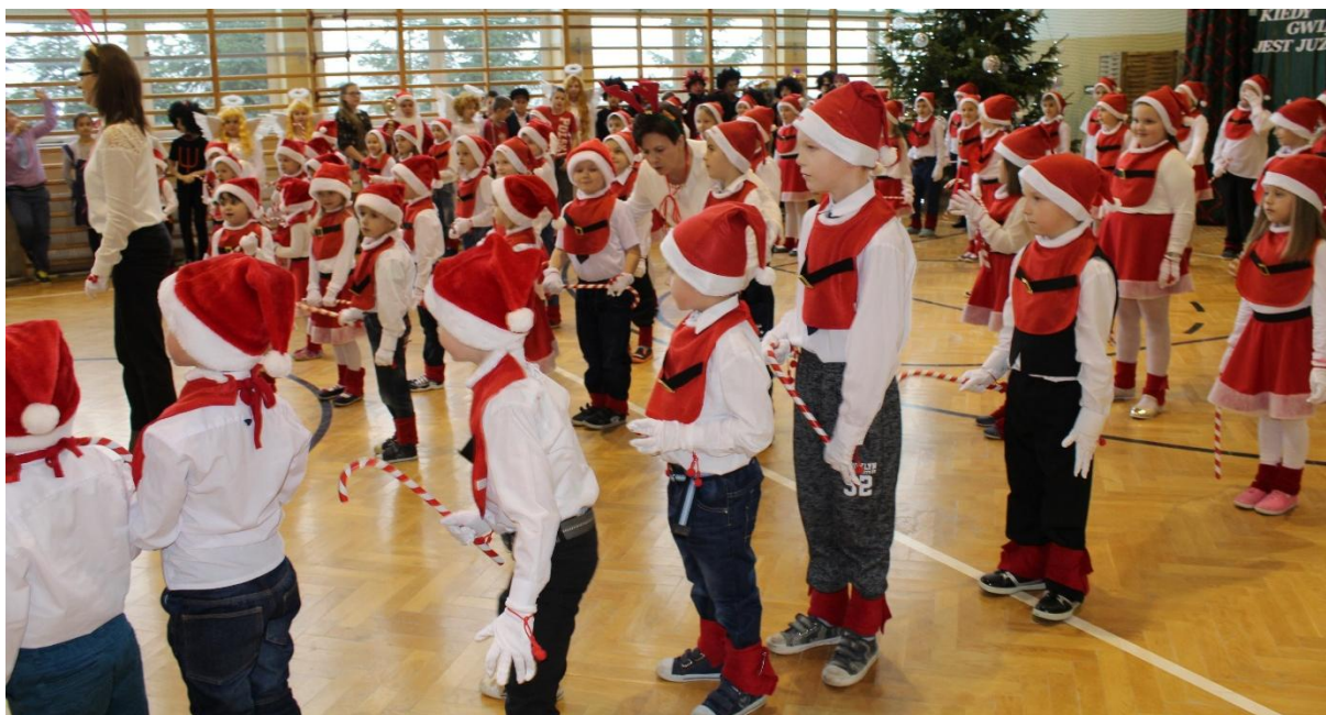
Jasełka w Sadłowie.