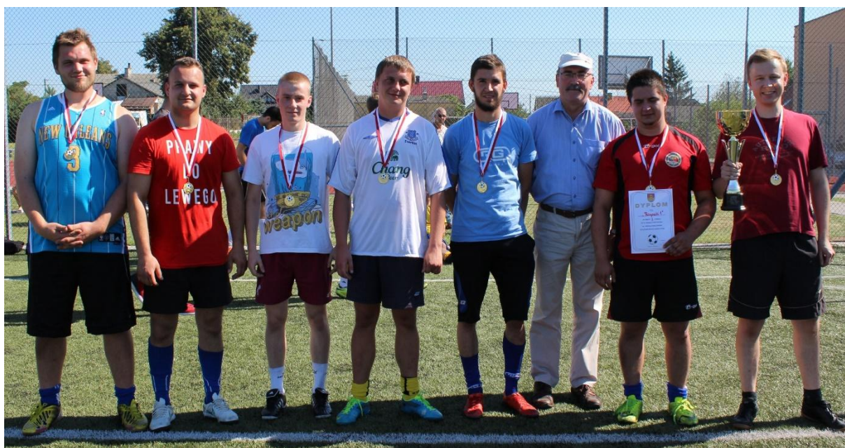
Zwycięzca turnieju – drużyna sołectwa Kowalki 1.