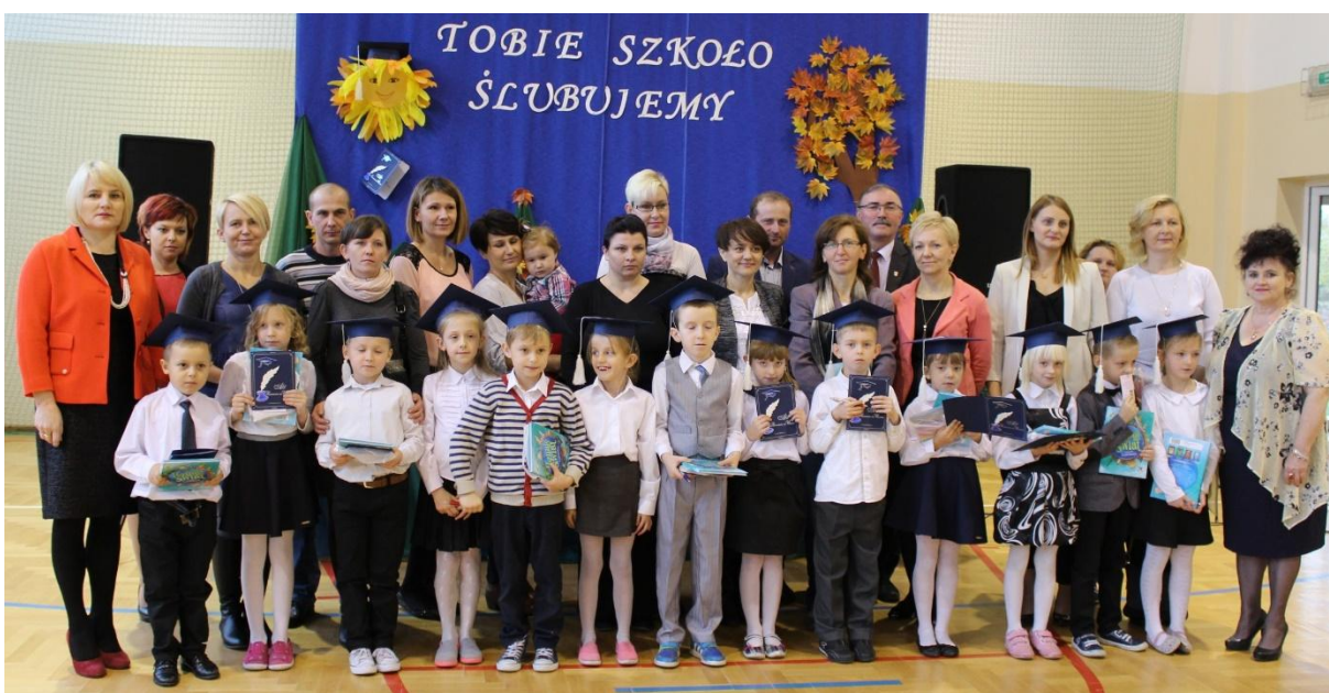
Pierwszaki z rodzicami i gośćmi w Szkole Podstawowej w Starorypinie Rządowym.