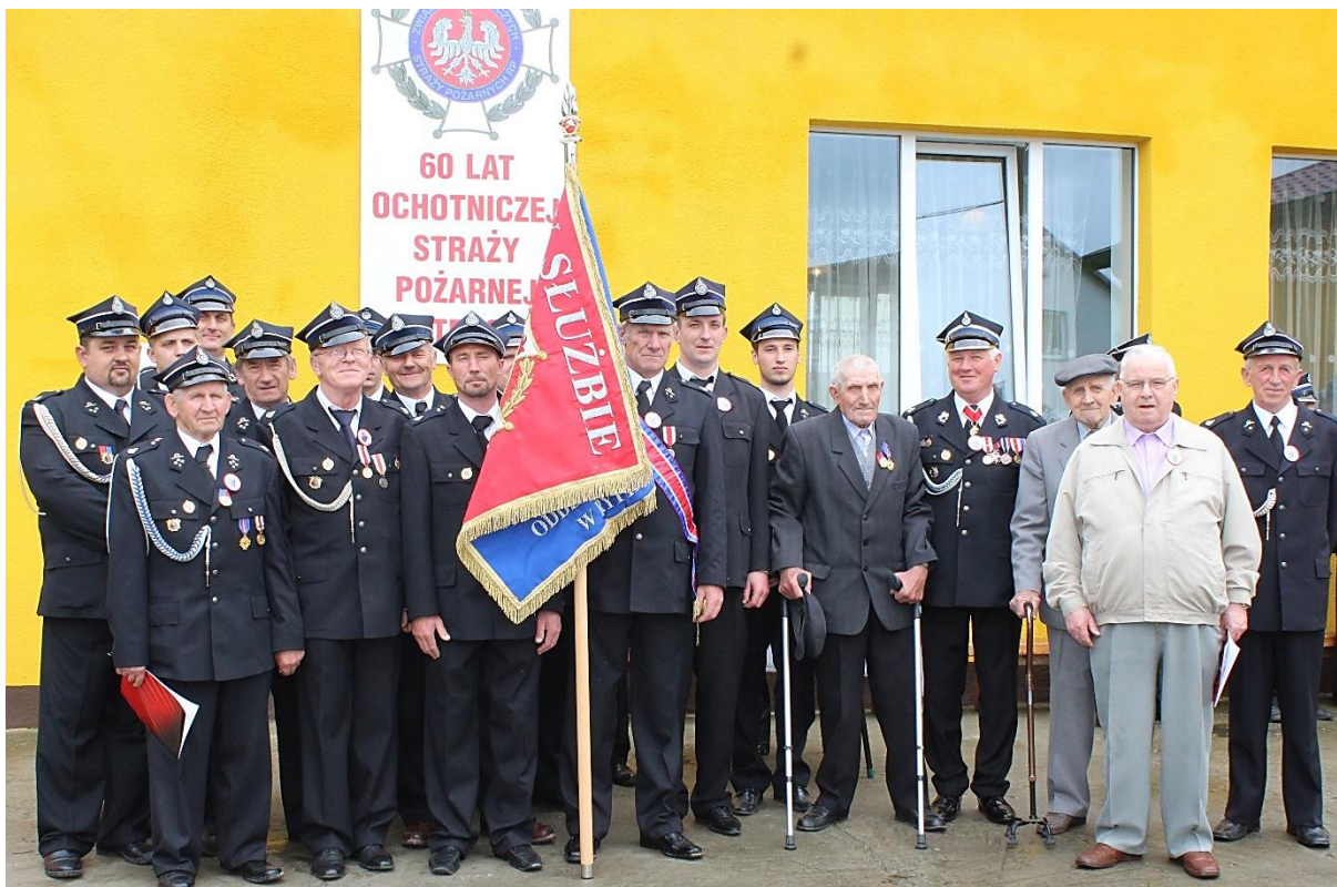
Jednostka OSP w Stępowie.