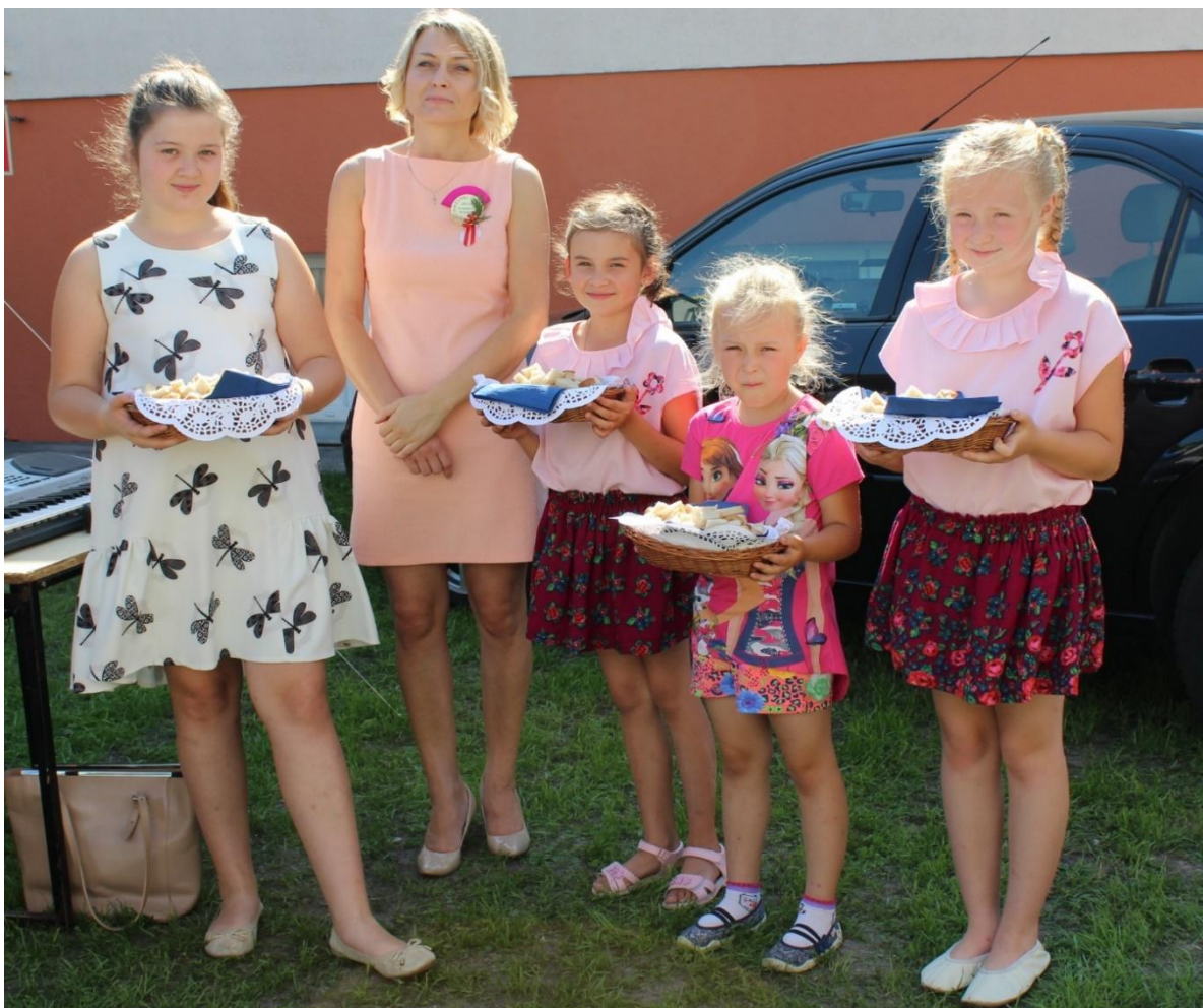
Przygotowania do dzielenia się chlebem.