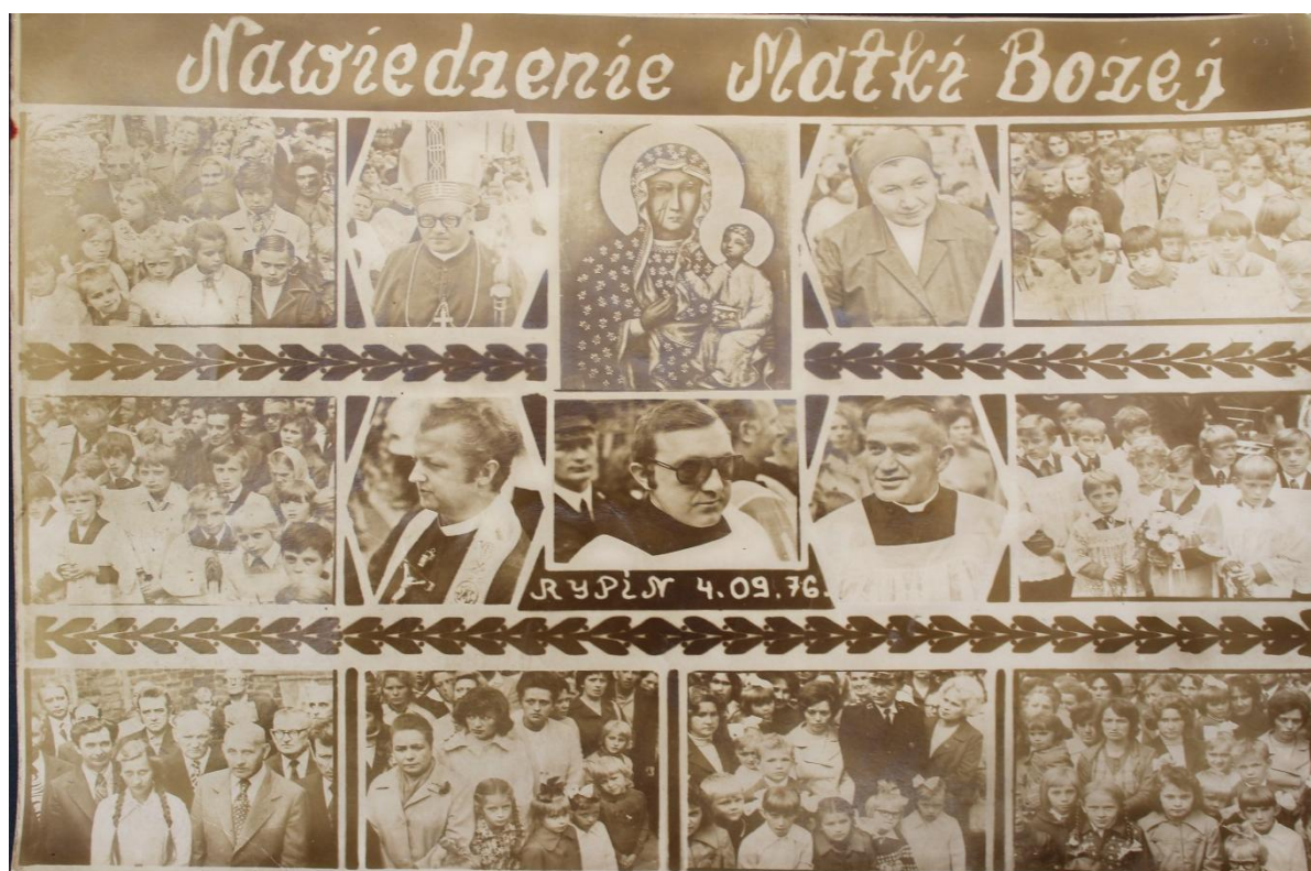
Tak było 40. lat temu.