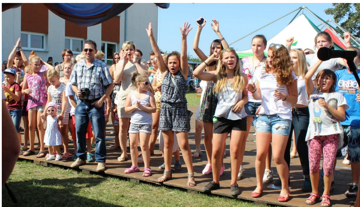
... i jego rozbawieni fani.