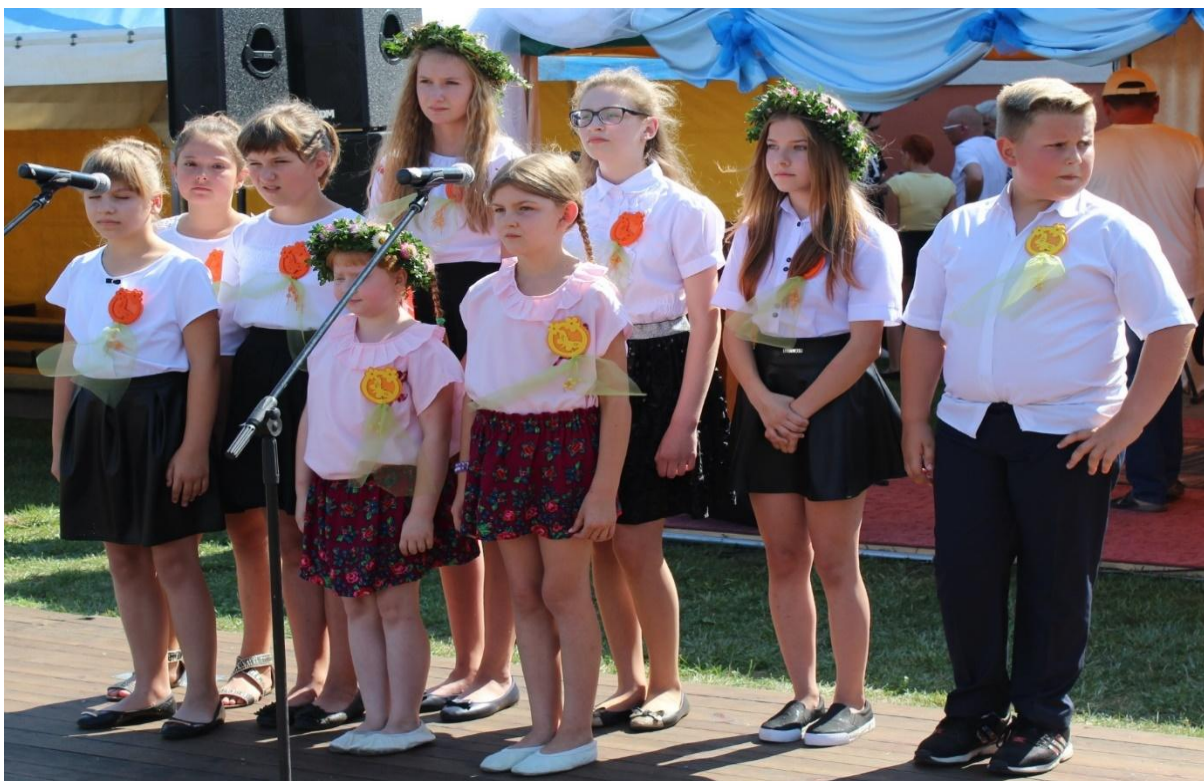
Występ dzieci ze Szkoły Podstawowej w Starorypinie Rządowym.