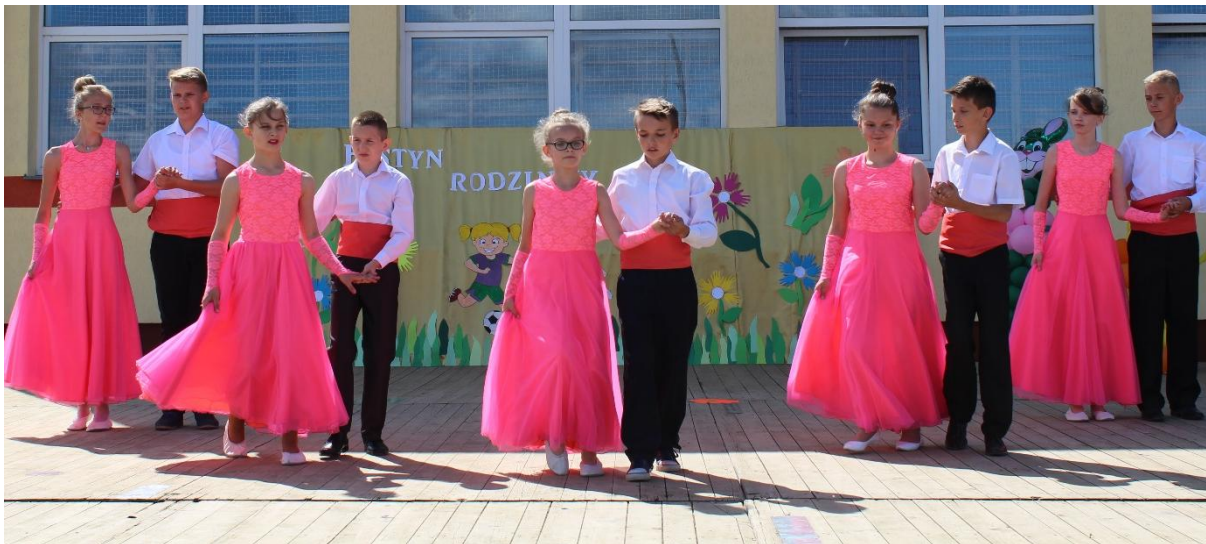
Zespół taneczny SP w Borzyminie w „walcu wiedeńskim”.

W maju i czerwcu w Szkołach Podstawowych w Sadłowie, Starorypinie Rządowym, Stępowie, Borzyminie i Zakroczu odbyły się festyny i pikniki rodzinne. Zaprezentowano przedstawienia sceniczne, występy artystyczne, pokazy rycerskie i strażackie, rodzinne zmagania sprawnościowe, zawody sportowe itp.