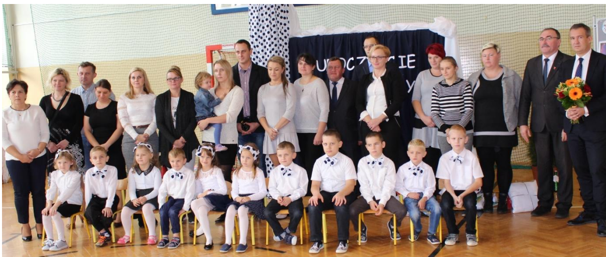
Pierwszaki z rodzicami i gośćmi w Szkole Podstawowej w Sadłowie.