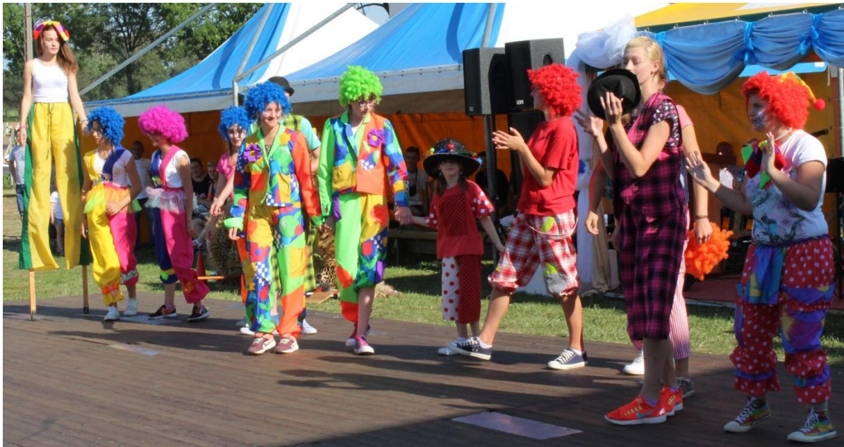
Grupa Cyrkowa Gimbolo.