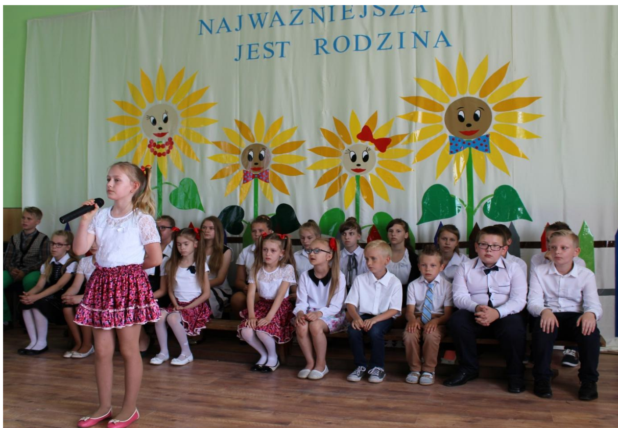
Występ dzieci podczas festynu w Stępie.