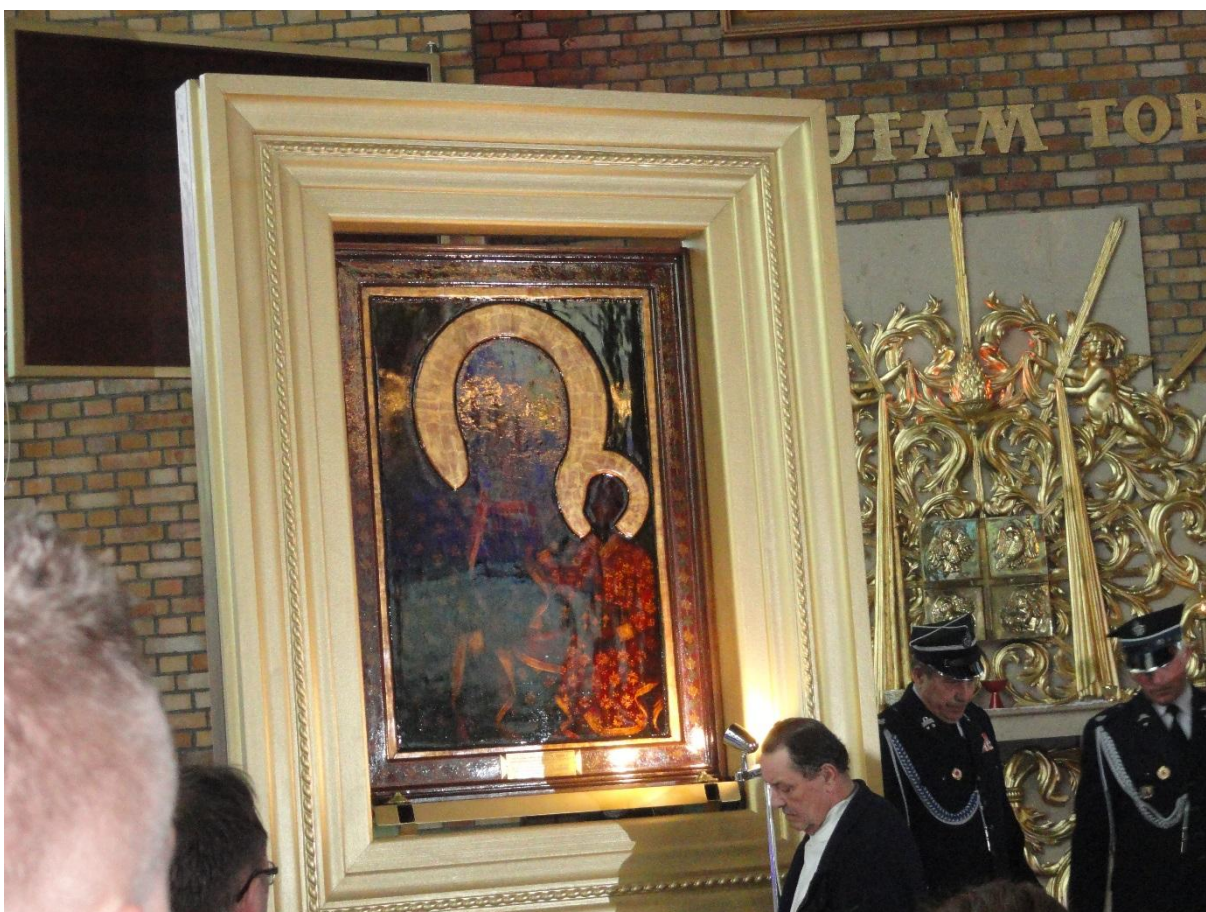
Obraz w kościele parafialnym p.w. Św. Stanisława Kostki w Rypinie.