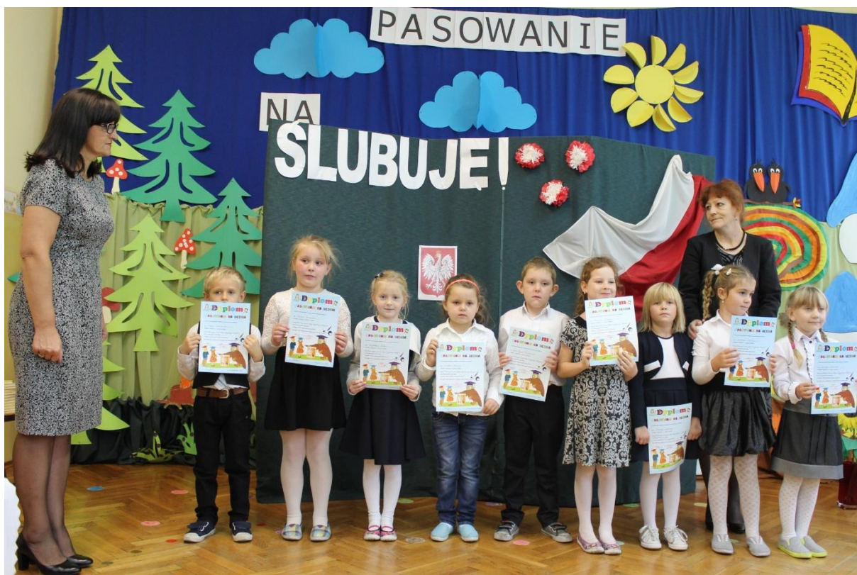
Pierwszoklasiści w Szkole Podstawowej w Borzyminie.