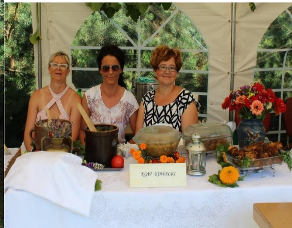
Stoiska Kół Gospodyń Wiejskich.