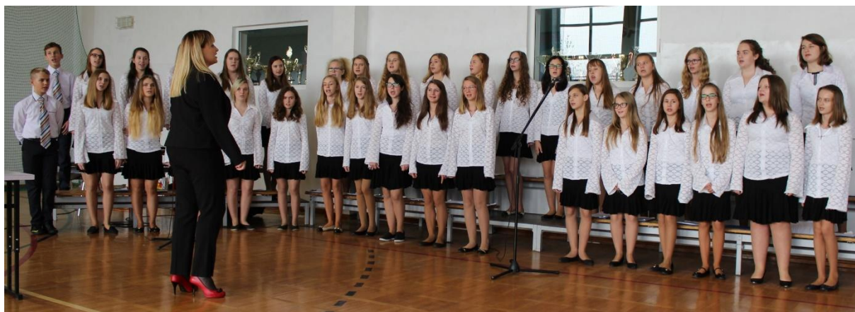
Chór szkolny podczas Mszy Świętej.