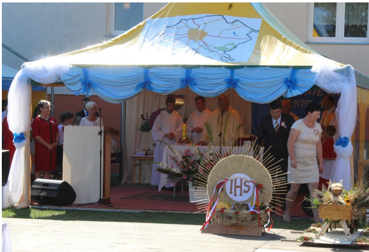
Ołtarz podczas Mszy Świętej Dziękczynnej.