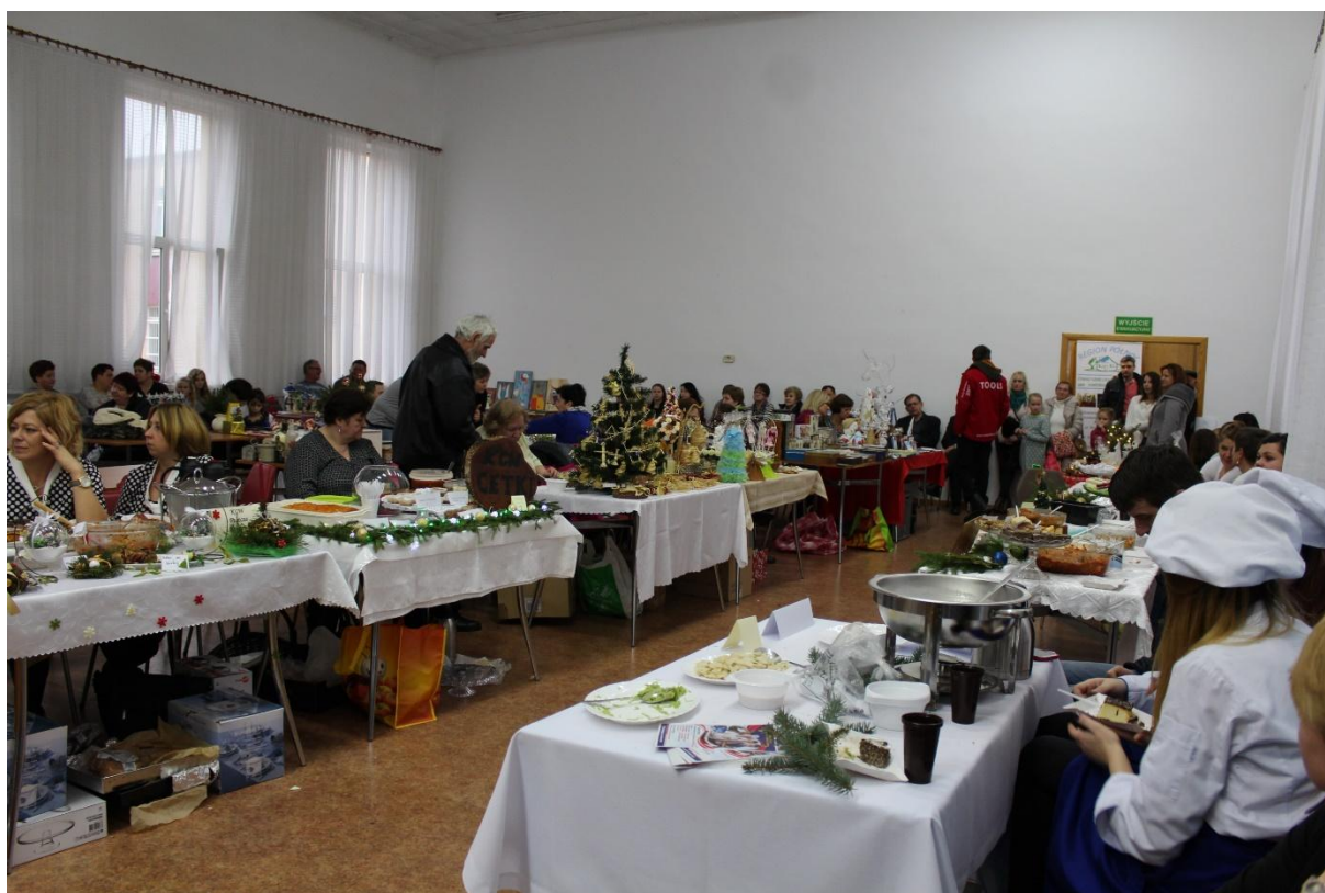
Widok ogólny sali.