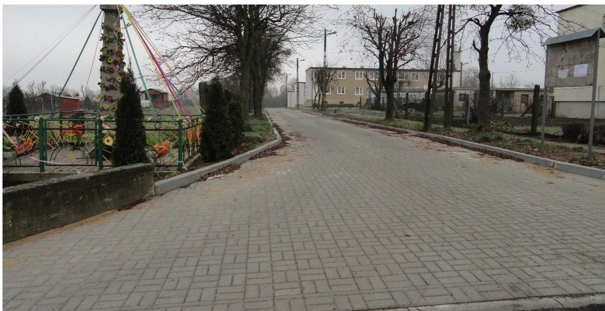
Utwardzona droga na Osiedlu Mieszkaniowym w Starorypinie Prywatnym.

W sierpniu 2016 roku zakończono budowę drogi utwardzonej polbrukiem na Osiedlu Mieszkaniowym w Starorypinie Prywatnym o powierzchni 336 m 2 . W 2015 r. na tej drodze położono polbruk na powierzchni 446 m 2 , co daje łącznie 782 m 2 .