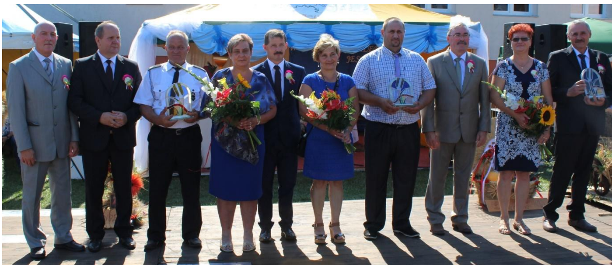
Wyróżnieni rolnicy wraz z gośćmi dożynek.