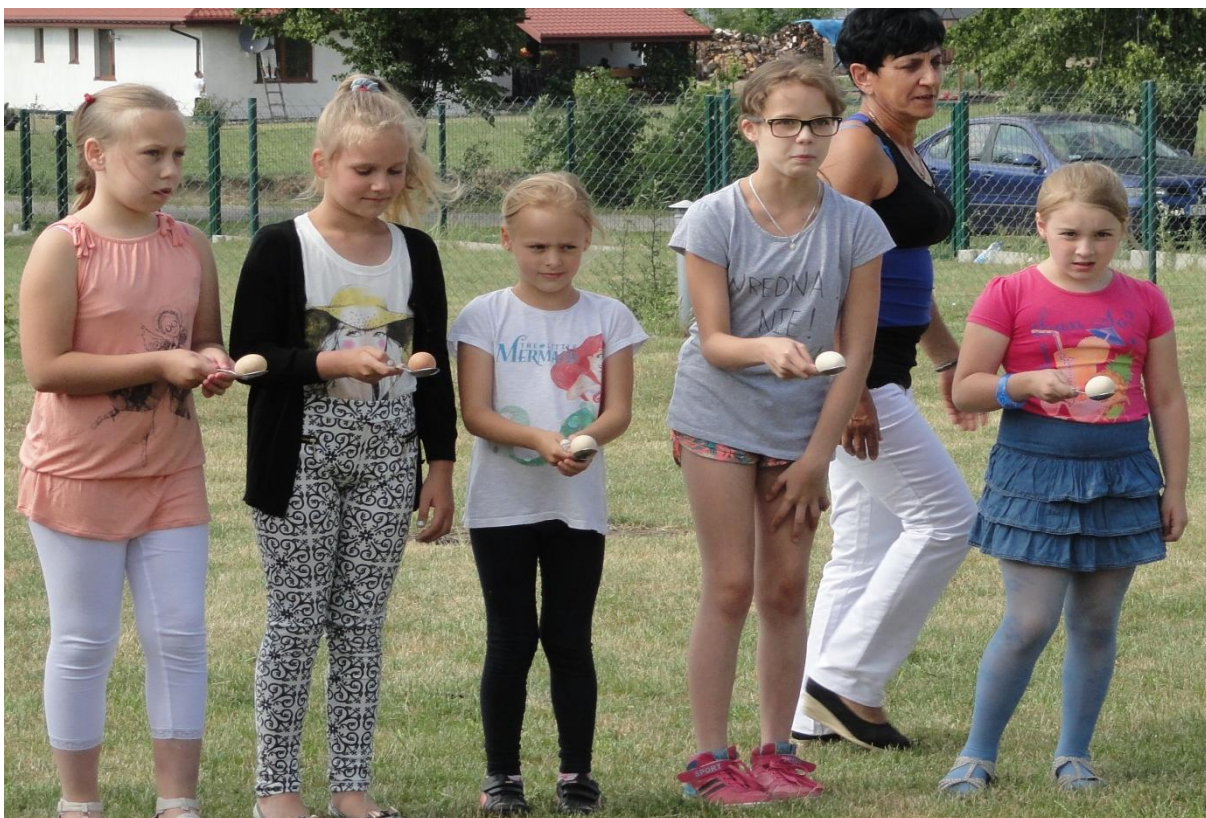
Bieg z jajkiem na festynie „U Jana” w Mariankach.