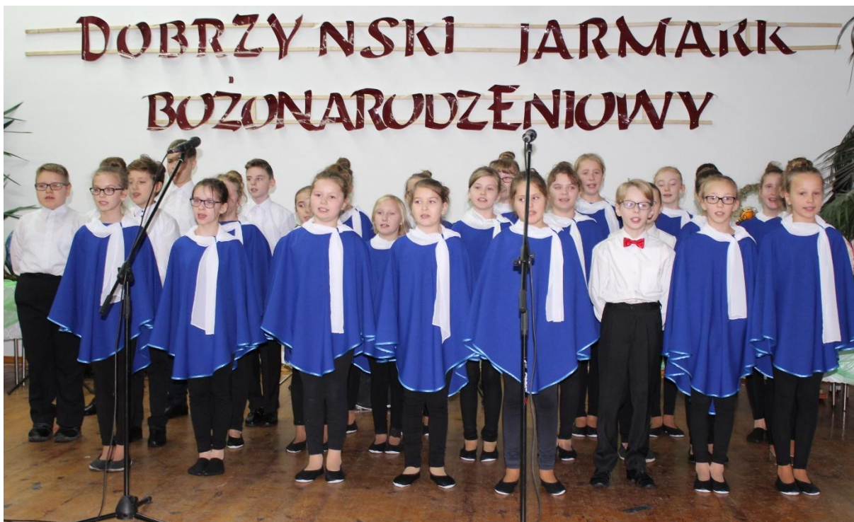
Zespół wokalny Szkoły Podstawowej w Borzyminie.