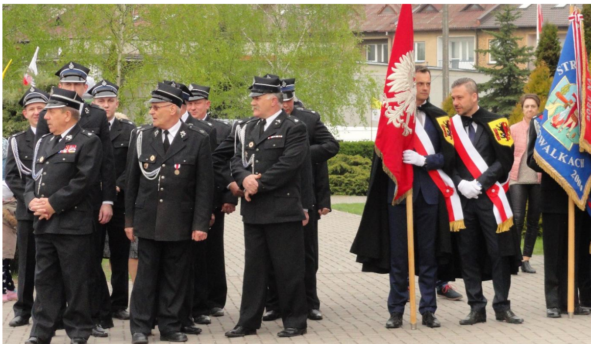
Oczekiwanie na obraz przed kościołem w parafii Św. Stanisława Kostki.