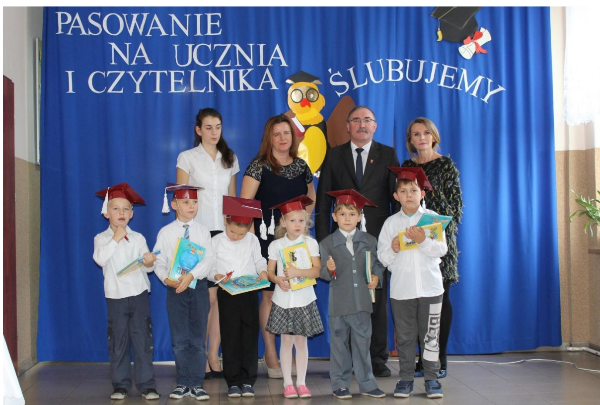
Pasowani na uczniów w Szkole Podstawowej w Zakroczu.