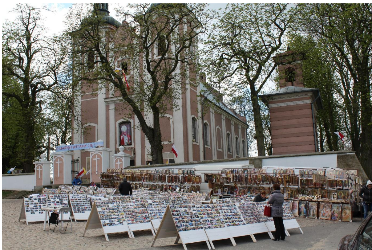
Przed kościołem w Sadłowie.