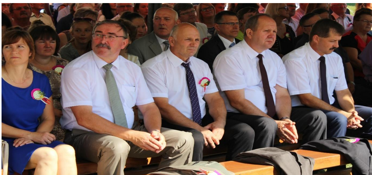
Goście dożynek podczas mszy.