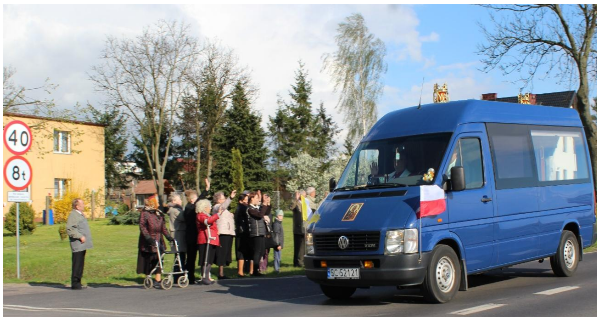
Samochód – kaplica z obrazem żegnanym przez mieszkańców wsi Marianki podczas odjazdu do Osieka.