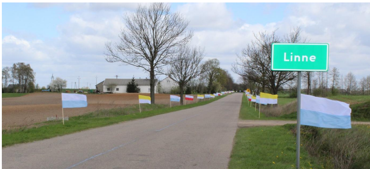
Przystrojona flagami droga w Linnem.

W dniach od 17 do 27 kwietnia 2016 roku na Dekanat Rypin odwiedziła kopia obrazu Matki Boskiej Częstochowskiej. To wyjątkowe święto także dla mieszkańców gminy Rypin. Terminy nawiedzenia obrazu w poszczególnych parafiach obejmujących teren gminy Rypin były następujące: 17.04.2016 r. – parafia Świętej Trójcy w Rypinie, 21.04.2016 r. – parafia Sadłowo, 23.04.2016 r. – parafia Świętego Stanisława Kostki w Rypinie, 27.04.2016 r. – parafia Żale. W czasie peregrynacji obrazu wierni niezwykle tłumnie odwiedzali swoje świątynie. Nic dziwnego, albowiem ostatnio takie uroczystości na terenie Diecezji Płockiej miały miejsce 40. lat temu.