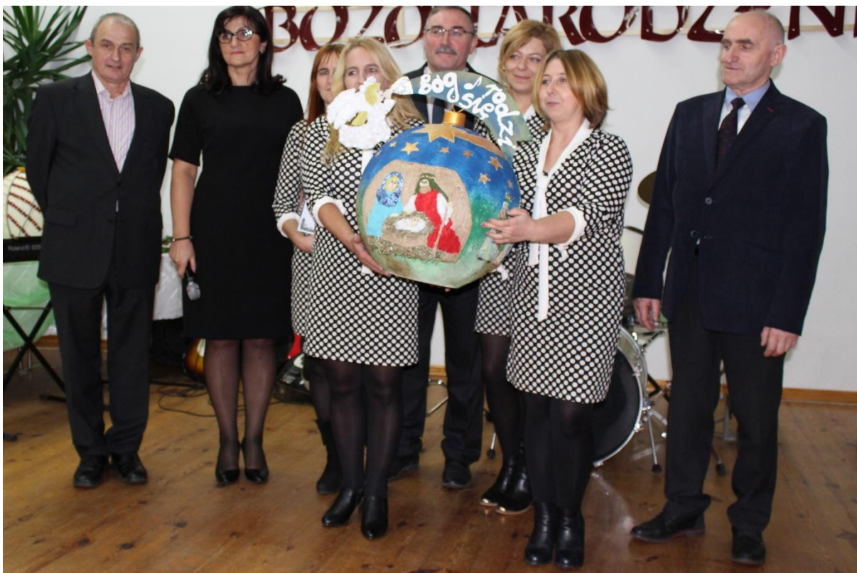
Przedstawiciele KGW w Puszczy Rządowej z nagrodzoną bombką.