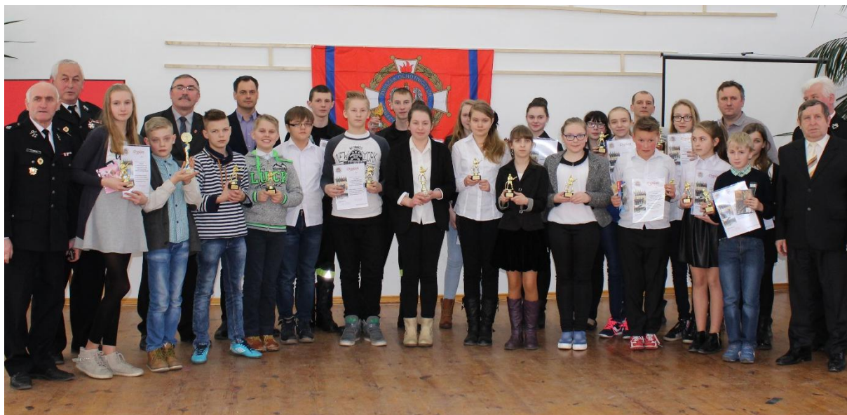
Uczestnicy, organizatorzy, opiekunowie eliminacji.