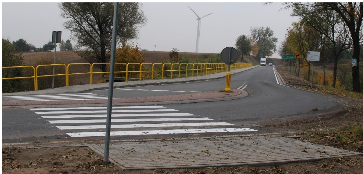
Droga powiatowa w kierunku Świdziebni.

Przebudowa drogi powiatowej Zdroje-Górzno-Starorypin obejmowała 5 km odcinek i polegała na wykonaniu frezowania nawierzchni jezdni w miejscach skoleinowanych, przebudowie nawierzchni jezdni poprzez wykonanie bitumicznej warstwy wyrównawczej (wiążącej) w ilości 110 \text{ kg/m}^2 i ścieralnej grubości 4 cm oraz wzmocnieniu poboczy na szerokości 0,5 m. Wybudowany został ciąg pieszy długości 1,3 km i trzy zatoki autobusowe wraz z peronami przystankowymi. W ramach prac na tej drodze odtworzone zostały rowy odwadniające, wykonano ścieki odprowadzające wodę opadową oraz wpusty uliczne wraz z przykanalikami, przebudowano zjazdy wraz z przepustami i wymieniono uszkodzony przepust pod drogą. Zamontowano oznakowanie i urządzenia bezpieczeństwa ruchu drogowego, w tym namalowano linie krawędziowe. Wartość zadania (z nadzorem inwestorskim) wyniosła 1 816 948,14 zł, w tym z budżetu państwa 908 474 zł. Wkład gminy Rypin w przebudowę drogi wyniósł 25 % wartości całego zadania tj. 454 237 zł. Odbiór techniczny drogi odbył się w dniu 14 października 2016 roku.