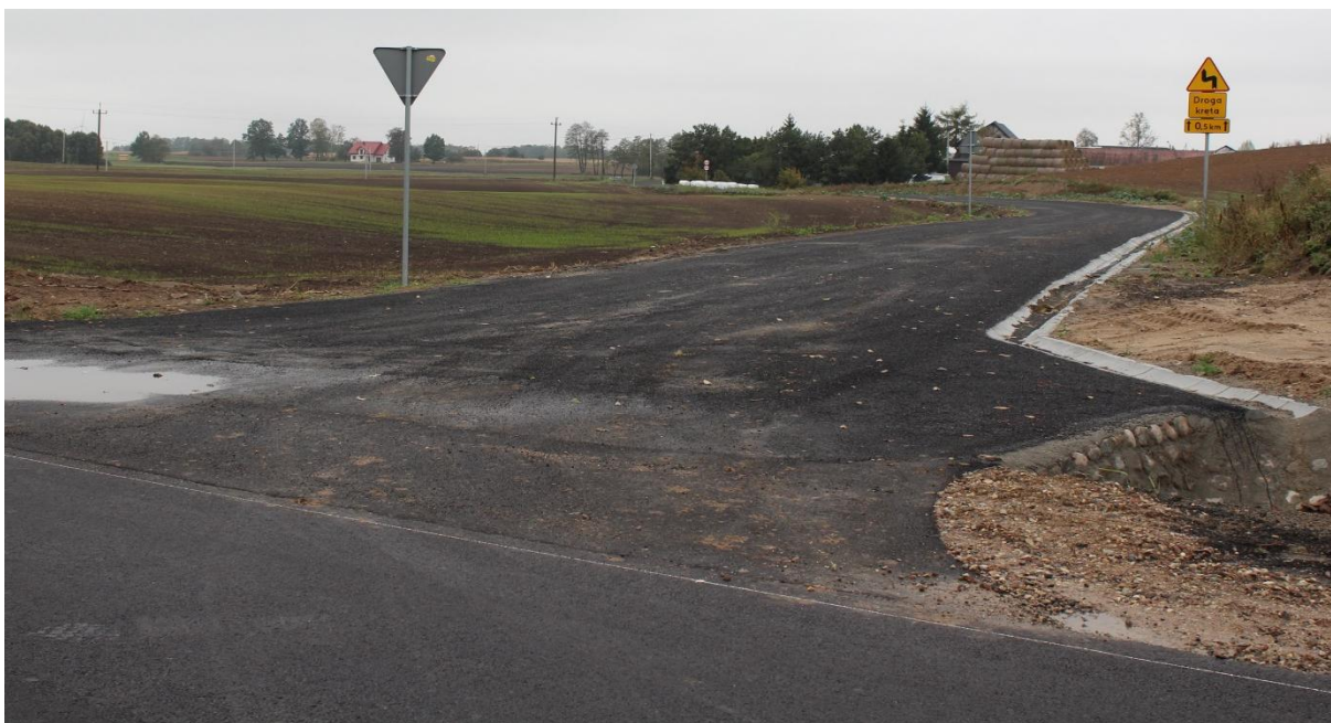
Droga w Stawiskach.

W sierpniu 2016 roku zakończono budowę drogi utwardzonej polbrukiem na Osiedlu Mieszkaniowym w Starorypinie Prywatnym o powierzchni 336 m 2 . W 2015 r. na tej drodze położono polbruk na powierzchni 446 m 2 , co daje łącznie 782 m 2 .